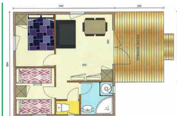
Die Chalets und ihr Grundrissplan (großes Chalet)